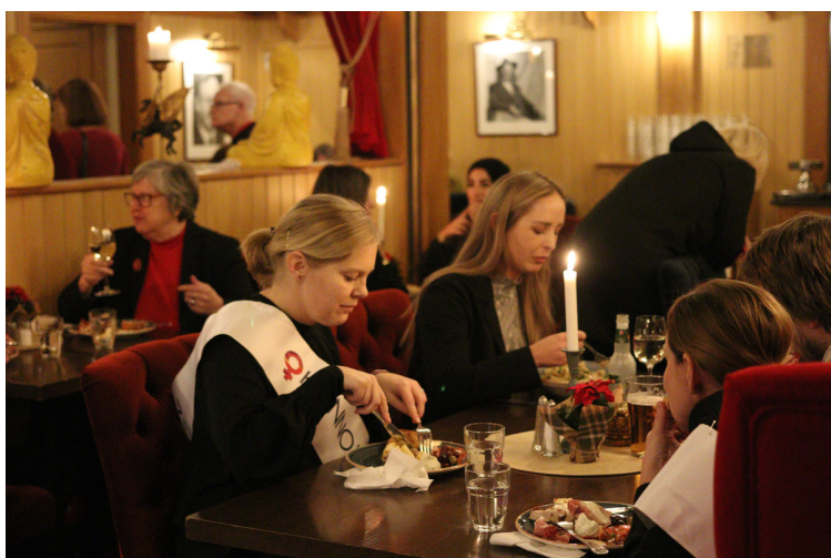
Jourens anställda berättade om händelser under verksamheten 40 år. Kvällen avslutades med en italiensk buffé