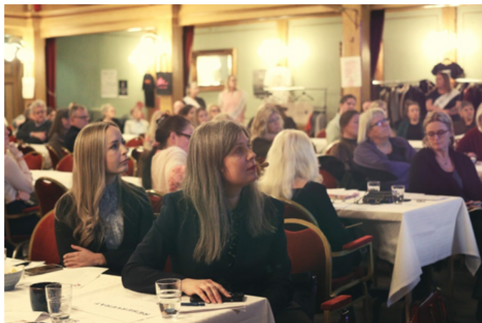
Många bra föreläsare, härlig underhållning och engagemang lockade hundratalet besökare..